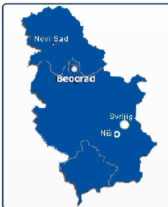
Положај општине Сврљиг на мапи Србије

Туристички положај Сврљига се огледа кроз близину котлине и саме варошице већим центрима туристичке дисперзије (Ниш, Зајечар, Пирот...) као и положај у односу на главне саобраћајне токове у региону, који уједно чине и главне туристичке токове. Гледано са саобраћајног аспекта, Сврљиг је на само 20 км од источног крака коридора 10 (Ниш – Софија) што представља велику предност када су у питању саобраћајно – туристички токови. Сврљиг се такође налази на свега 40 км удаљености од новог центра зимског туризма у Србији – Старе планине што положај Сврљига чини потенцијало изузетно атрактивним. Због близине коридора 10, Сврљиг је директно повезан и са великим европским градским центрима (Софија, Београд, Нови Сад, Скопље). Такође је повезан, преко магистралног правца Ниш – Зајечар – Неготин – Кладово са Дунавом.