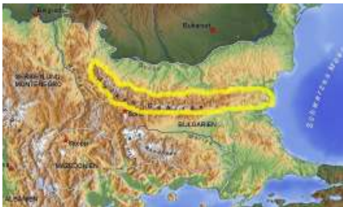
Балкански планински масив

Балкански планински масив чији део у Србији препознајемо као Стару планину, док је назив у Бугарској и околним земљама планина Балкан, је планински венац у источном делу балканског полуострва . Протеже се дужином од 560 км од Вршка Чуке на граници између Србије и на исток кроз централну Бугарску до рта Емине на Црном мору . Највиши врхови на Старој планини су у централној Бугарској . Највиши врх је Ботев (2.376 м), налази се у Националном парку Централна Балкана (основан 1991). Планина даје име Балканског полуострва.