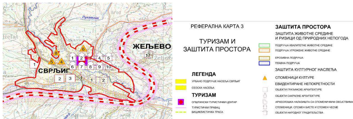
Извод из ППО Сврљиг-Туризам и заштита простора

Просторним развојем инфраструктурних система, у области водоприврене инфраструктуре, предвиђа се спровођење заштите квалитета вода, у оквиру тимчког и јужноморавског регионалног система водотокова, применом технолошких, водопривредних и организационо-економских мера кроз: потпуну санитацију насеља и изградњу канализационих система за одвођење употребљених и атмосферских вода и њихово контролисано испуштање у водопријемнике након пречишћавања; доградњу постојећег постројења за пречишћавање отпадних вода уз дефинисање свих извора загађења (формирање регистра мањих загађивача и спровођење катастра загађивача); уклањање дивљих депонија дуж водотокова и одлагања чврстог отпада на санитарној депонији.